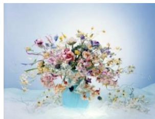
香りの花せっけん／ ルナブランカ