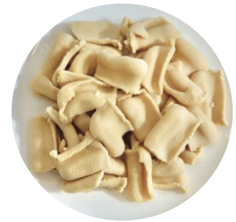
今回新たに発売する 「ソイルプロ 冷凍スライスタイプ白」 (写真は解凍後)

(※)IQF凍結：瞬間凍結方法の一種。Individual Quick Frozen (Individual：個別の Quick：急速 Frozen：凍結)の頭文字からとった凍結方法のこと