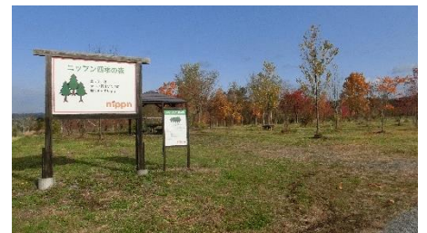
北海道深川市にある「ニッポン四季の森」

ニッポングループが製造する商品の多くは、自然の恵みに深く恩恵を受けており、当社はこれまでも北海道にあるグループ所有の遊休地を「ニッポン四季の森」として整備・解放するなど、生物多様性保全に対する取り組みを進めてきました。また、経団連自然保護基金への資金支援も行っています。今後も、ニッポンの生物多様性基本方針に沿って、取り組みを強化してまいります。