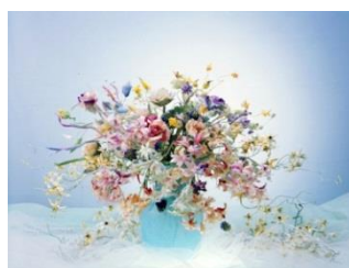
香りの花せっけん／ ルナブランカ