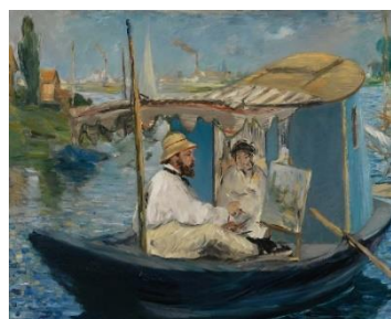
「ボートのアトリエで描くモネ」