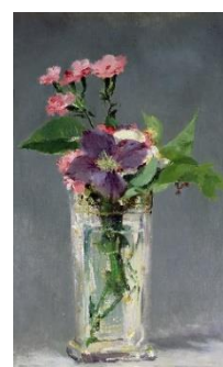
「ガラス花瓶のなかのカーネーションとクレマティス」