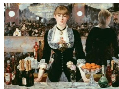
「フォーリー=ベルジュール劇場のバー」