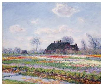
「サッセンハイムのチューリップ畑」