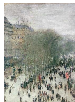
「カピュシーヌ大通り」