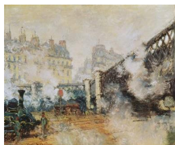
「ヨーロッパ橋、サン・ラザール駅」