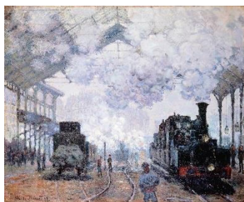
「サン・ラザール駅」