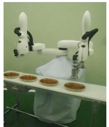
食材トッピングロボット